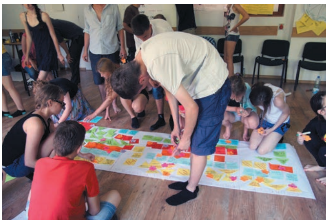
Program „Młody obywatel”

Od 2010 r. w program zaangażowało się niemal 390 szkół (gimnazjów i liceów) z całej Polski. Powstało 356 grup uczniowskich, które badały lokalny kapitał społeczny. 382 nauczycieli wzięło udział w kursie e-coachingowym, w ramach którego zdobyli oni wiedzę na temat pracy metodą projektu i budowania kapitału społecznego. Przeprowadzono również 65 warsztatów dla 825 nauczycieli oraz 75 warsztatów dla młodzieży, w których wzięło udział 1390 uczniów. Warsztaty służyły budowaniu umiejętności leaderskich i realizacji projektów na rzecz rozwoju lokalnego. Na trzy edycje programu fundacja przeznaczyła łącznie 1 157 000 zł.