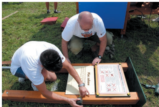
Program „Przyjazne przedszkole”