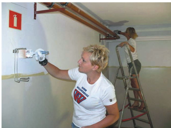
Program „Wolontariat jest super!”

Program prowadzony jest metodą konkursu, w którym pracownicy banku przygotowują własne projekty społeczne na rzecz instytucji publicznych (np. szkoły, przedszkola, świetlice, domy opieki, szpitale, schroniska, hospicja, ośrodki szkolno - wychowawcze) lub organizacji pozarządowych. Od początku trwania konkursu (2009 r.) wolontariusze zrealizowali 65 projektów społecznych. W realizację projektów zaangażowało się 325 pracowników banku.