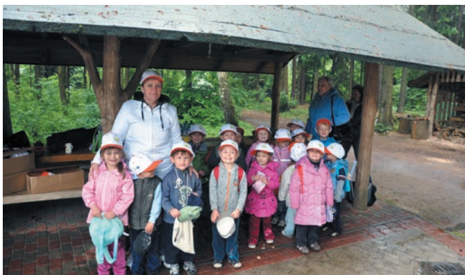
Program grantowy „Na dobry początek!”

Program „Na dobry początek!” ma na celu wspieranie małych społeczności lokalnych w edukacji dzieci w wieku przedszkolnym. Program stworzony został w 2008 r. w odpowiedzi na istniejący w Polsce problem, jakim jest niski wskaźnik upowszechnienia edukacji przedszkolnej w stosunku do pozostałych krajów Unii Europejskiej. Badania wykonane w roku szkolnym 2011/2012 pokazują, że edukacją przedszkolną w miastach objętych jest 83,8 % dzieci, natomiast na wsiach tylko 53,5 % maluchów chodzi do przedszkola lub korzysta z alternatywnych form opieki 1 . To jeden z najniższych wskaźników w Unii Europejskiej.